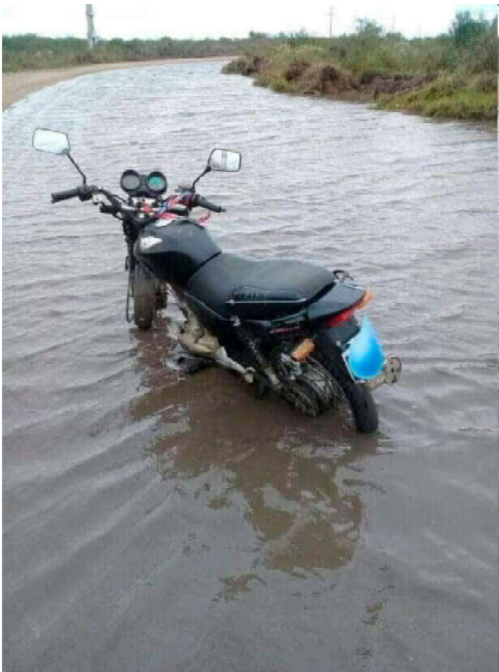
Ruta 28, curva de 'La Virgencita'.

Productores que recorren a diario los caminos que circundan a la localidad de El Redomón, han documentado la condición de pésimo estado en que se encuentra la ruta provincial 28, en particular en -por no afirmar en todo su recorrido- la zona "desde su empalme con ruta 4 y hasta El Redomón", expresaron a través de publicaciones en redes sociales. Consultado por Retórica, un productor que trabaja en campos de la zona señalada, sostuvo: "Este y varios lugares son