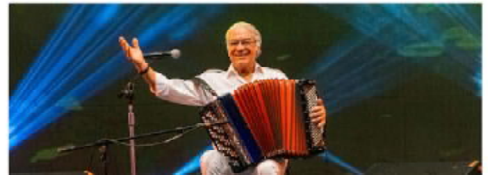
PUBLICACIÓN DEL DIARIO CLARÍN SOBRE EL FESTIVAL DE FEDERAL

Las bailantas más grandes del país brillaron en Federal, en otra edición del Festival Nacional de Chamamé, un imperdible de la región.