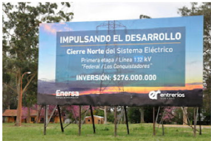
La habilitación de la estación transformadora de Federal no optimizó el servicio de energía, tal como se había prometido a los usuarios.

El padecimiento de los usuarios no se reflejó en similitud a la citada alusión; por el contrario, los sufridos clientes de la distribuidora de energía exteriorizaron sus bronca e indignación con escritos en las redes que no escatimaron en insultos. Las interrupciones en la provisión de energía, conllevan un lamento cotidiano. La crisis del sistema eléctrico se remonta a décadas, desde aquellos años 90' -por citar una fecha estimativa en el tiempo- en que comenzó a prometerse la obra del Cierre del Circuito Norte, en el centro (-norte, valga la redundancia) de la