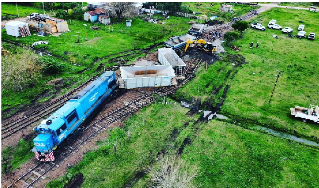
Descarriló un tren de cargas en Estación Yerúa (Concordia).

El Gobierno nacional inauguró la rehabilitación de 15 kilómetros de vías; a la vez que desde organismos vinculados a Ferrocarriles Argentinos se anuncia el proyecto de reanudación del transporte de pasajeros entre Concordia y Salto.